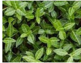
Euonymus fortunei 'Tustin' Japanse kardinaalshoed