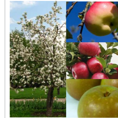
Fruitbomen Malus domestica 'Jasappel', 'Sterappel' en 'Lemoen' Deze soorten zijn geschikt om elkaar te bestuiven.