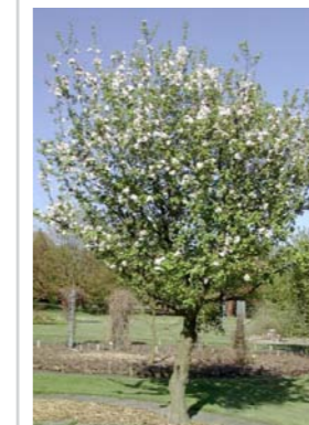
Malus sylvestris wilde appel Hoogte: 7-9 m Bloei: april/mei, roze/wit Vrukt: groengeel, 3-4cm