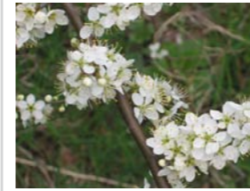
Prunus spinosa sleedoorn Inheemse stekelige struik. Vroege bloeier. Blauwe vruchten.

De beplanting onder de bomen is op de meeste plekken laag, maar soms is er een dichter gedeelte. Om de biodiversiteit te verhogen vullen we de beplanting aan met een aantal inheemse soorten.