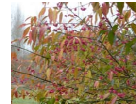
Euonymus europaeus kardinaalsmuts Inheemse struik. Opvallende bessen en herfstkleur.