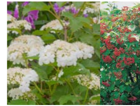
Viburnum opulus 'Compactum' Gelderse roos