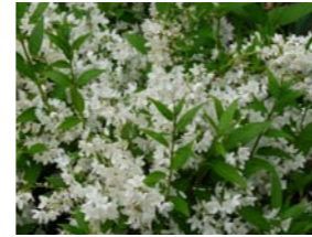
Deutzia gracilis 'Nikko' bruidsbloem