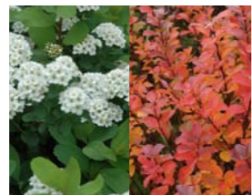
Spiraea betulifolia 'Tor' spierstruik