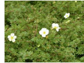
Potentilla fruticosa 'Dart's Cream' ganzerik