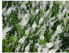
Clethra alnifolia 'White Spire' schijnels