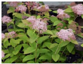
Spiraea fritschiana 'Pink Parasols' spierstruik