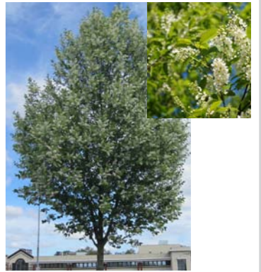
Prunus padus gewone vogelkers Hoogte: 8-12 m Bloei: april, wit, geurend Vrukt: zwart