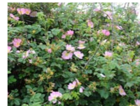
Rosa rubiginosa egelantier Inheemse struik. Bloei in juni/augustus. Rode botfels. Blad ruikt naar frisse appeltjes.