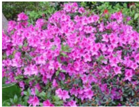
Rhododendron 'Beethoven' rododendron