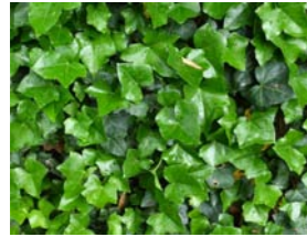
Hedera helix klimop

Deze heesters staan in de plantvakken tussen de flats. Het zijn lage soorten. De hoogte loopt van 20 cm tot 1 m. Ze staan hier op volgorde van hoogte, van laag naar hoog.