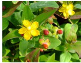
Hypericum inodorum 'Rheingold' hertshooi