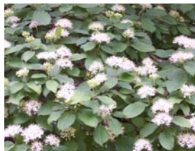
Cornus sanguinea rode kornoelje Inheemse struik. Bloei in mei/juni, soms nabloei. Rode twijgen in de winter.