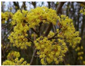
Cornus mas gele kornoelje Inheemse struik. Zeer vroege bloeier. Belangrijk voor insecten in het vroege voorjaar.

Op een paar plekken staat een hogere struik boven de lage struiken.