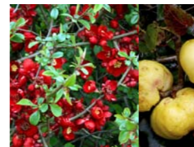
Chaenomeles 'Crimson and Gold' dwergkwee