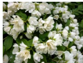
Philadelphus 'Manteau d'Hermine' boerenjasmijn