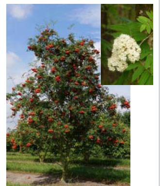
Sorbus aucuparia gewone lijsterbes Hoogte: 10-15 m Bloei: mei/juni, wit Vrukt: oranje-rood Herfst: geel/oranje/rood