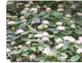
Cornus sanguinea rode kornoelje Inheemse struik. Bloei in mei/juni, soms nabloei. Rode twijgen in de winter.