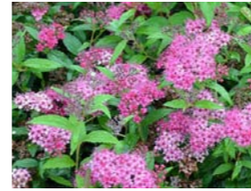
Spiraea japonica 'Dart's Red' spierstruik