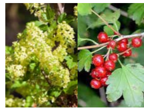
Ribes alpinum 'Schmidt' alpenbes