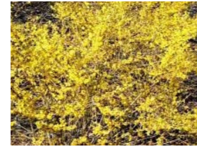
Forsythia 'Maree d'Or' Chinees klokje