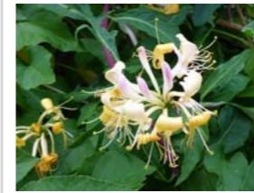
Lonicera periclymenum wilde kamperfoelie Inheemse klimplant. Bloei juni/oktober. Sterke zoete geur in de avonduren.