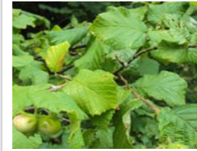
Corylus avellana hazelnoot Inheemse struik. Vrukt is de bekende noot.