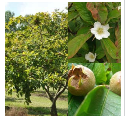
Mespilus germanica mispel Hoogte: 6-8 m Bloei: mei/juni, wit Vrukt: bruin, 4-5 cm