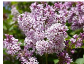
Syringa 'Minuet' sering Lage sering. Bloei in mei. Heerlijke geur.