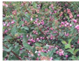
Symphoricarpos doorenbosii 'Magic Berry' sneeuwbes