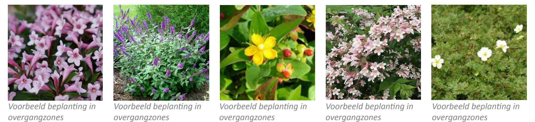
Voorbeeld beplanting in overgangszones

Vergroenen Vergroenen van OVERGANGSZONES , die twee natuurlijke zones met elkaar verbinden. In dit geval Het Morspark en de singels langs de Smaragdlaan en het Morspark met de singel langs de Azurietkade.