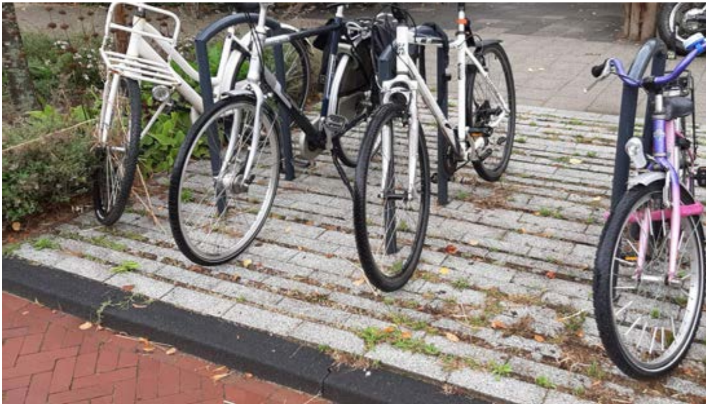
Fietsbeugels in waterpasserende stenen