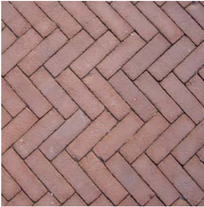
Rijweg bestrating - nieuw