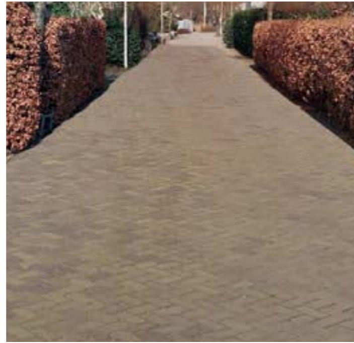
Rijweg bestrating - hergebruik