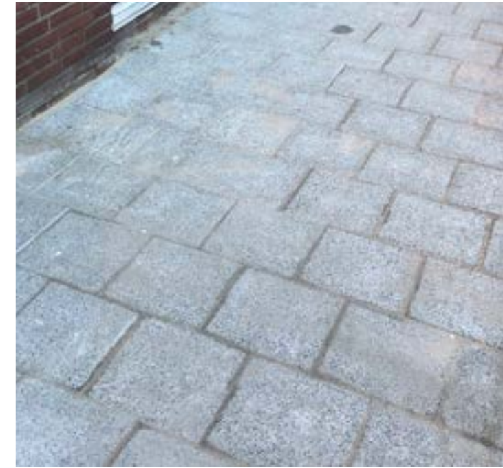
Stoep (deels hergebruikte tegels)