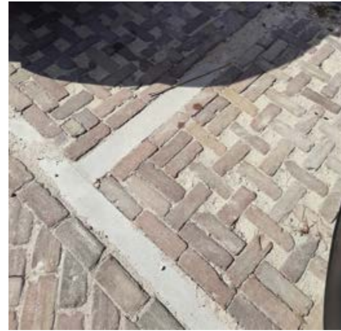
Parkeervakken met hergebruikte klinkers en openingen voor waterinfiltratie