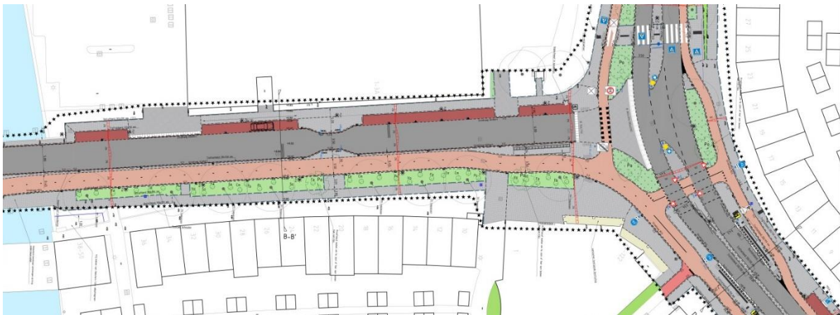
Definitief ontwerp Zoeterwoudseweg ten noorden van de Veilingbrug