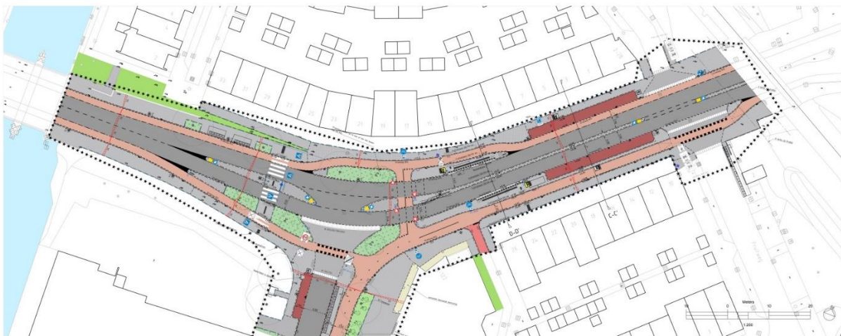
Definitief ontwerp Vrijheidslaan