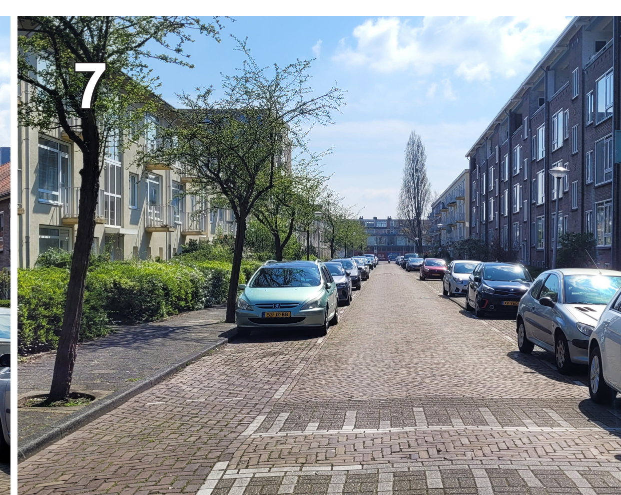
7 Hoflaan: voortuinen, 2 zijden parkeren en een kleine boomsoort.