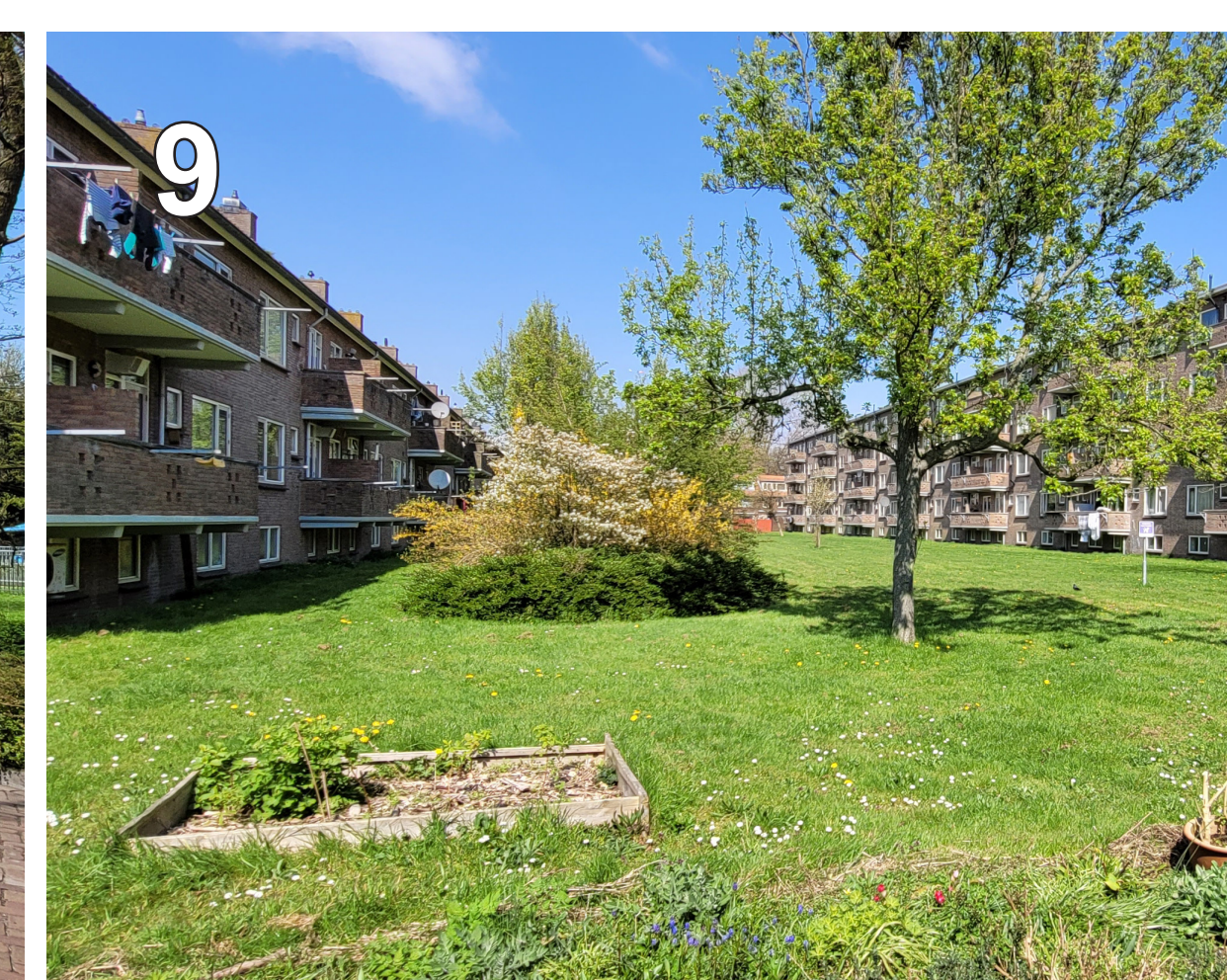
9 Binnenterrein: groot en groen, weinig afwisseling.