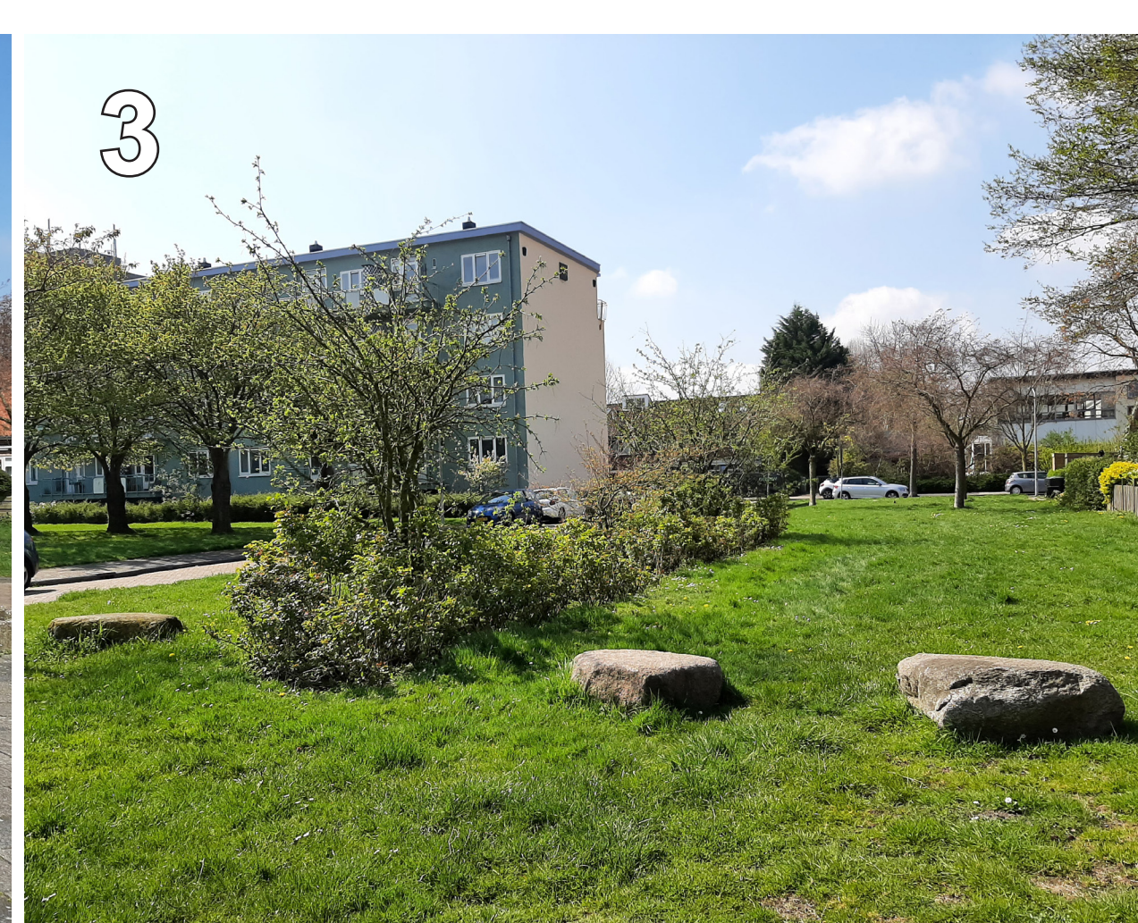
3 Segaarstraat: brede groenstrook met anti doorrijvoorziening.