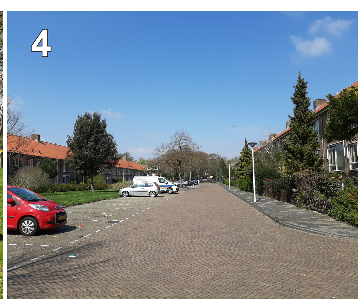
4 Gerri Kasteinstraat: brede groenstrook met dwarsparkeren. Lage struiken en nog kleine bomen, die wel groot kunnen worden.