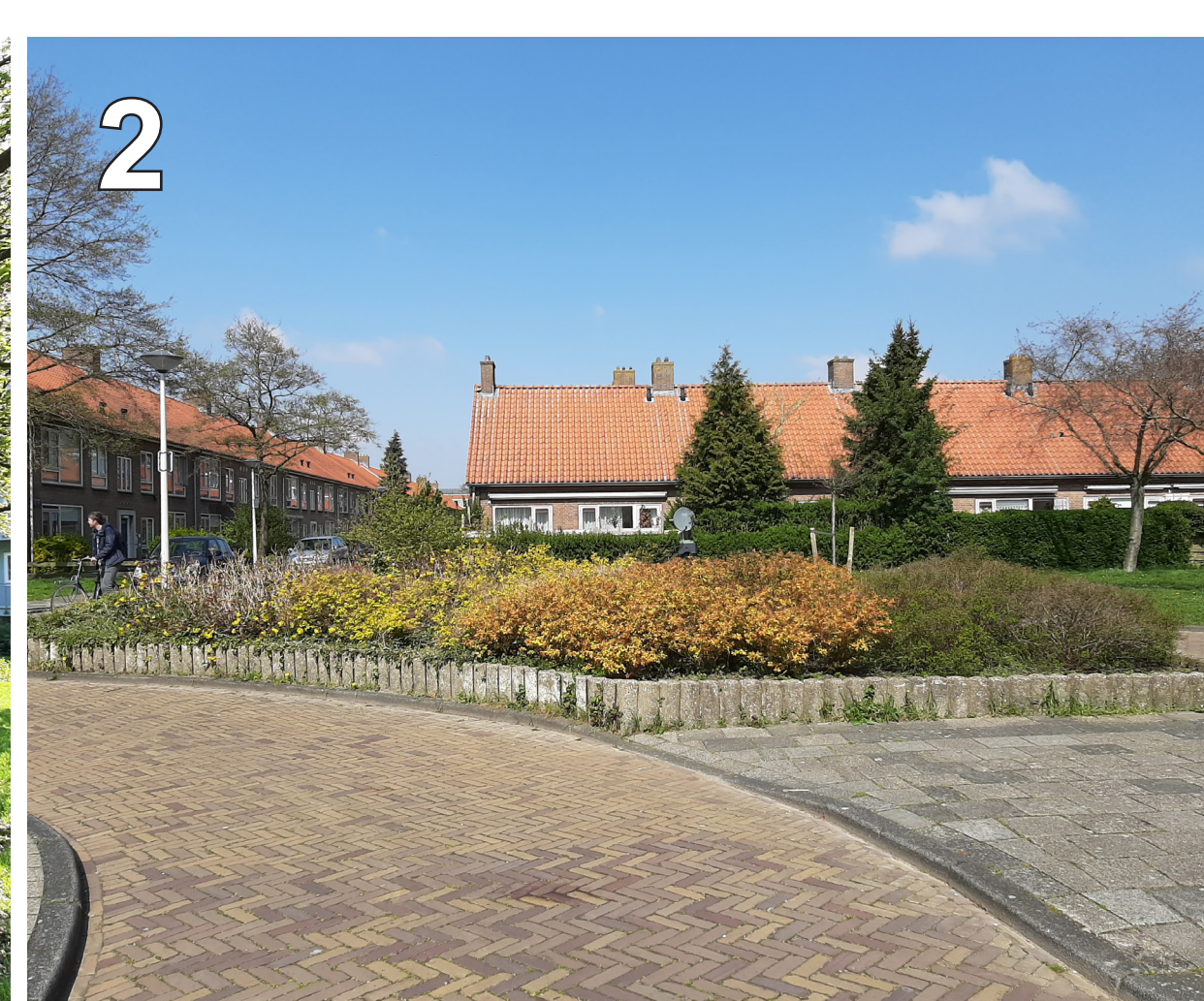
2 Segaarstraat: één van de verkeersknips met een schakelpalen plantenbak.