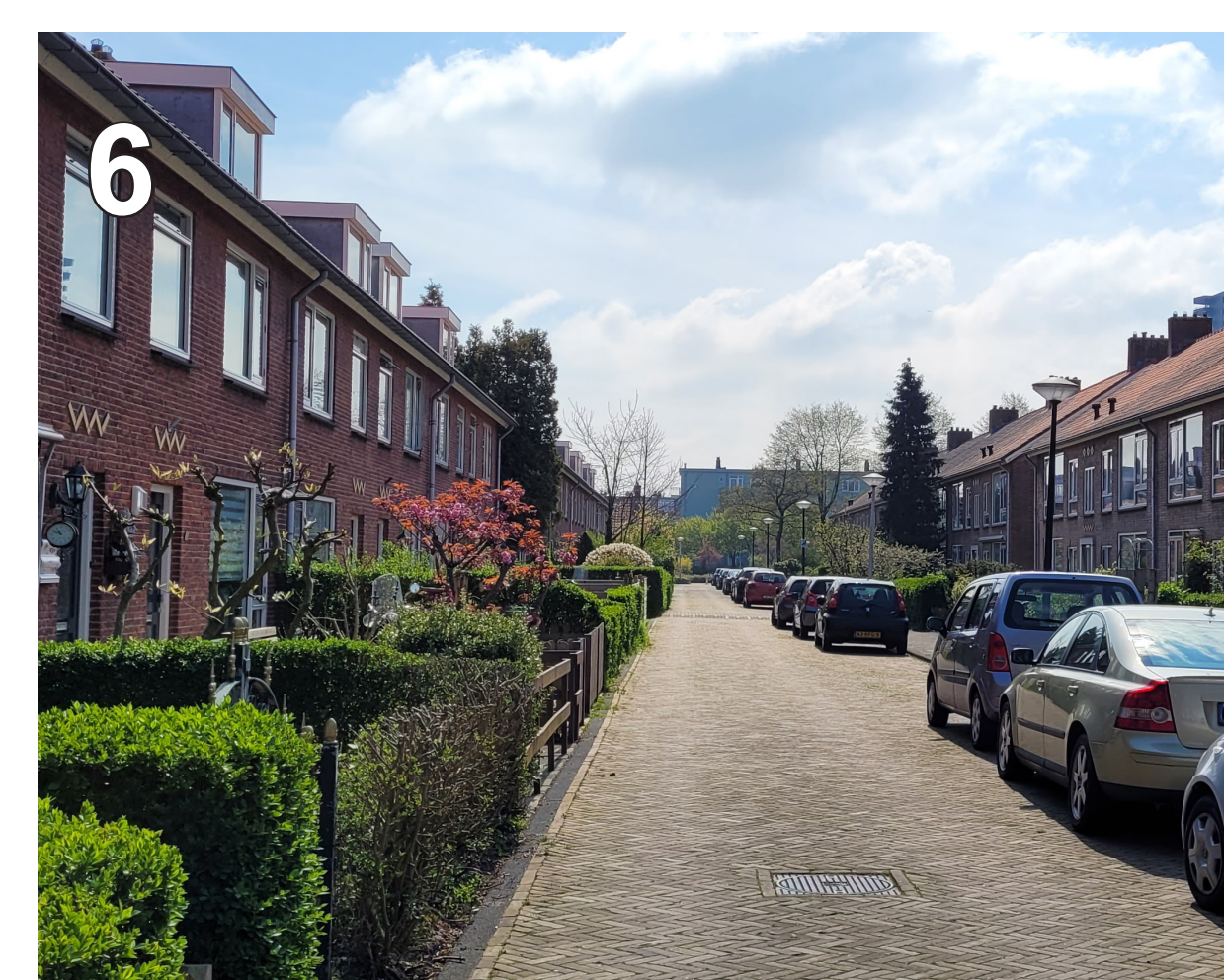
6 Mulderstraat: smal met groene voortuinen. Tweerichtingsverkeer, terwijl dat eigenlijk niet past.