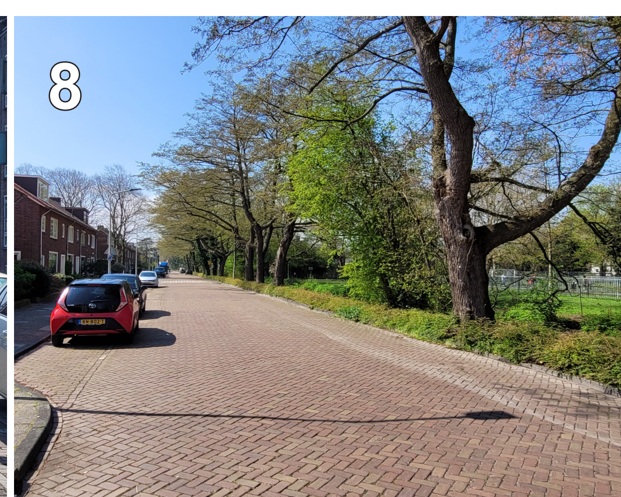
8 Telderskade: smalle berm met steile oever langs watergang. De grote bomen hebben nauwelijks groeirimte.