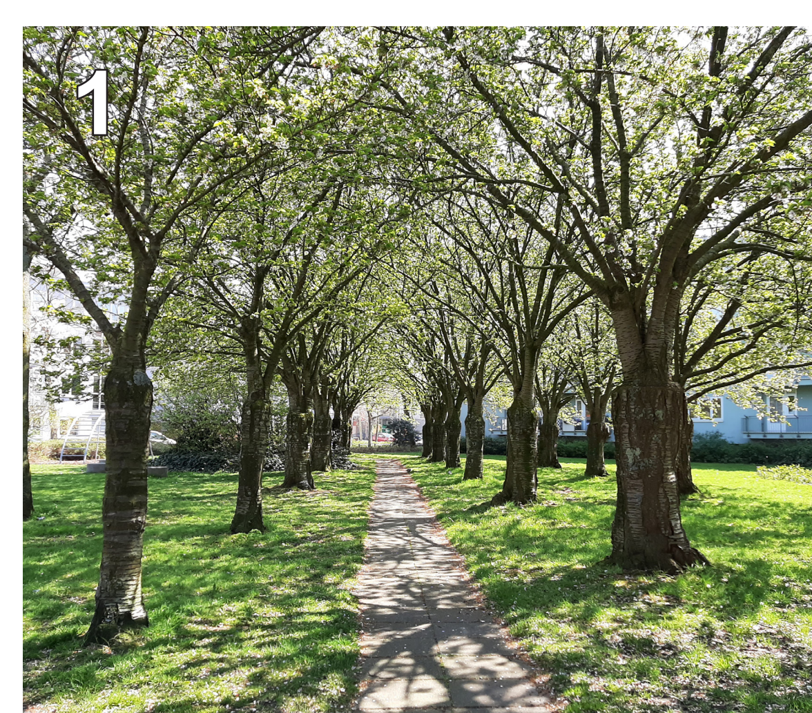
1 Segaarstraat woningbouw: prettige groene plek met speelplekje.