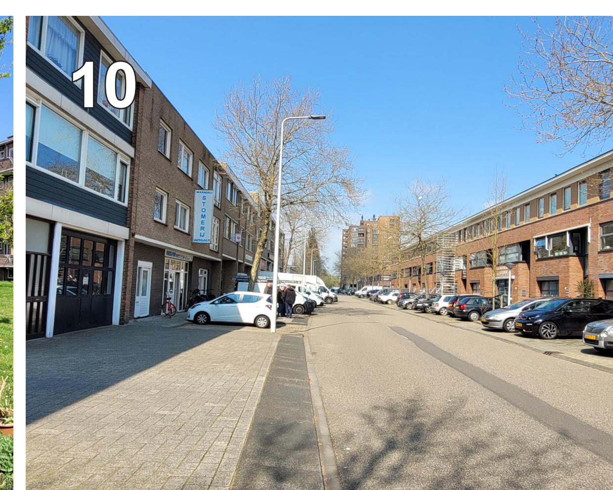
10 Rooseveltstraat: bedrijven aan de westkant en woonwerk situatie aan de oostkant. Geparkeerde busjes steken uit over de weg. Het verkeer is gemixt. Het is ook een belangrijke fietsroute.