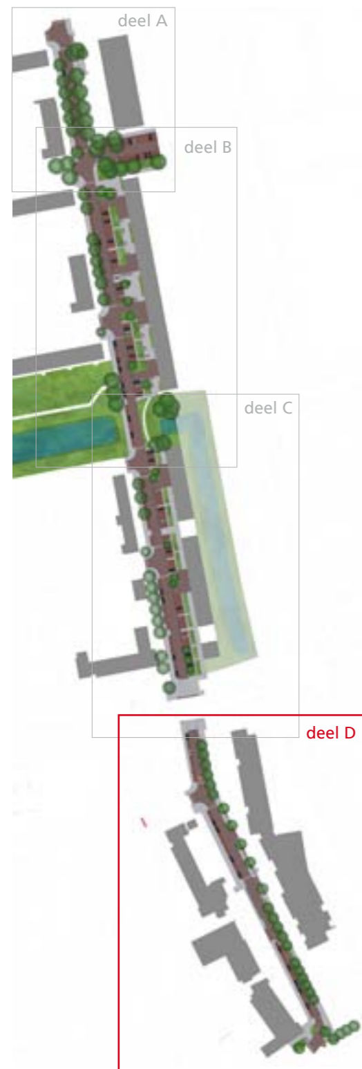
Bachstraat 101 tm 197