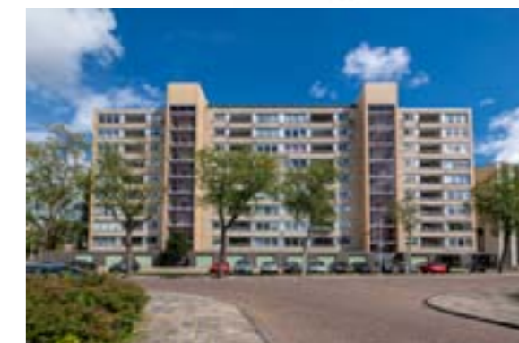
Bachstraat 564 tm 796 - Het Gouden Hart (zorgappartementen)