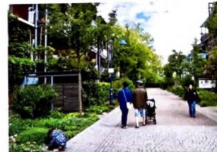
aardig groen, auto-loos straatje