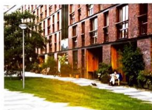
leuk groen, maar te hoog