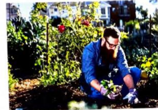
... en dit ook.