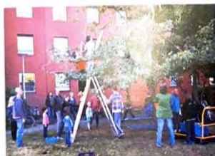
bomen, heel belangrijk, groen is belangrijk