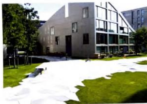
2 aardige, multifunctionele gebouwen