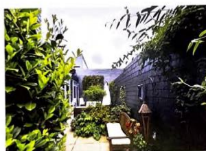
overal wilt groen te realiseren, maar als daktuin niet hoger dan 3 hoog