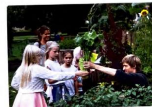
dat zou goed zijn...