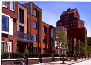
monie afwisseling in vorm en kleur