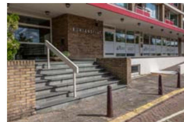
Bachstraat 2 tm 256A - Rijnlandflat